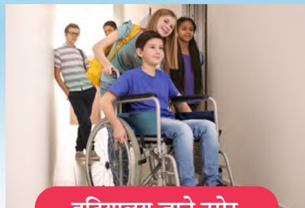
विद्यालय जाने उमेर